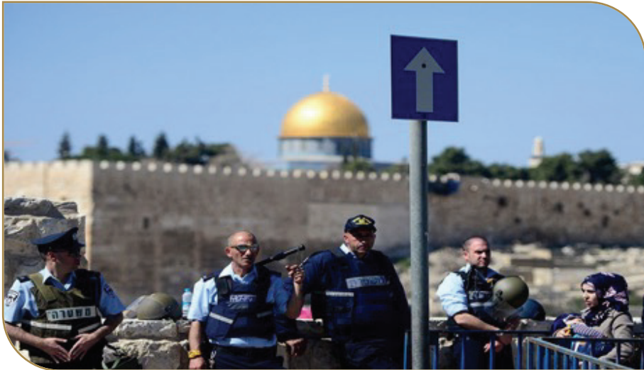
جنود صهيانية يمنعون المصلين من الوصول للمسجد الأقصى المبارك

وحذرت من أن اتخاذية إجراءات من شأنها تغيير الوضع التاريخي والديني القائم في القدس سيفجر المنطقة ويدفع إلى مزيد من الصراعات والأزمات التي لن تنتهي إلا بزوال هذا العدو الغاصب، مشددة على أن المقاومة حق مشروع للدفاع عن الأراضي المغتصبة أقرته موثيق الأمم المتحدة.