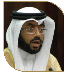
الشيخ إبراهيم الحادي