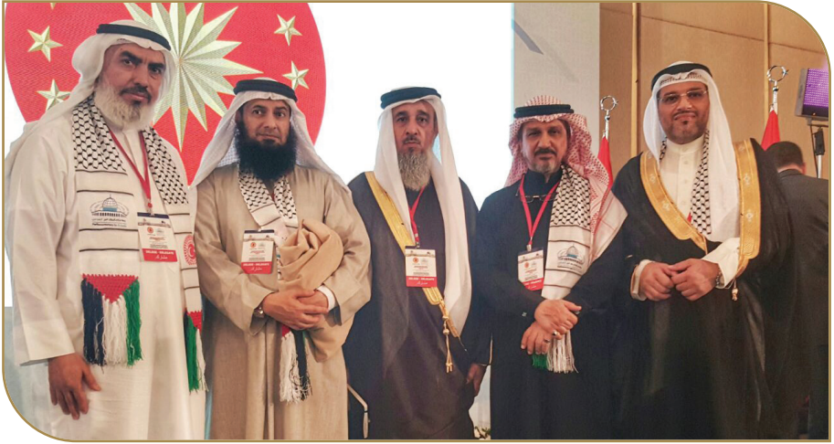
نواب بحرينيون مشاركون في مؤتمر برلمانيون لأجل القدس

وأوضح «الفضالة» في حوار خاص مع «الخليج الجديد» على هامش مؤتمر لرابطة برلمانيون من أجل القدس بتاريخ (١٩ ديسمبر ٢٠١٨)، أنه يجب أن يتم ذلك من خلال وضع قوانين وتشريعات في الدول العربية لتجريم كافة أنواع التطبيع مع العدو الصهيوني.