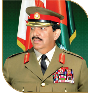
معالي المشير خليفة بن أحمد آل خليفة