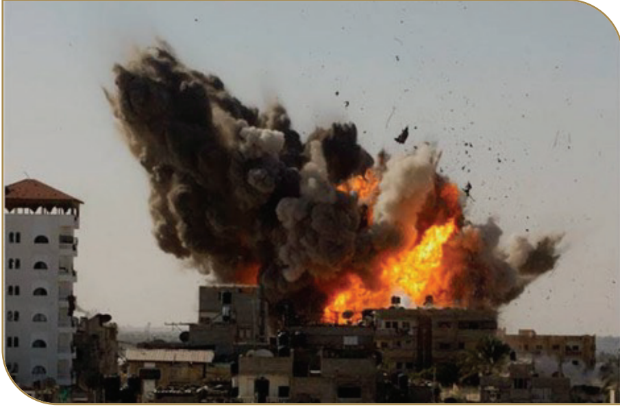
الاعتداءات الصهيونية على غزة 2008