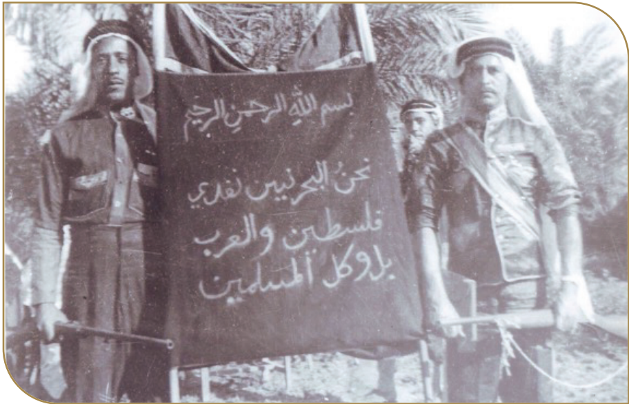
تاريخ بحريني مشرف في دعم القضية الفلسطينية

وقال العمادي: «الشعب البحريني بكل توجهاته وتياراته يرفض جميع أشكال وأنواع التطبيع مع الكيان الصهيوني ومثل هذه الاستضافة تمثل تحدياً لإرادة الشعب البحريني وخروجاً عن قرارات الجامعة العربية وعن الإجماع العربي والإسلامي وهي خطوة تمثل تطبيعاً مجانياً لا يمكن أن يقبل به الشعب البحريني الوفي للقضية الفلسطينية قضية العرب والمسلمين الأولى».