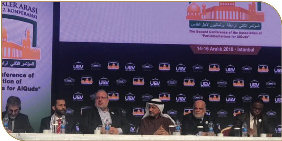
الشيخ ناصر الفضالة خلال مشاركته في مؤتمر برلمانيون لأجل القدس

وأكد على أنهم حرصوا خلال المؤتمر على إظهار الدور التاريخي المشرف لمملكة البحرين قيادة وشعباً في دعم حقوق الشعب الفلسطيني ورفض التطبيع بكافة أشكاله وصوره والتمسك بالثوابت الوطنية تجاه فلسطين وفي القلب منها القدس الشريف.