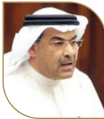
النائب حسن بوخماس