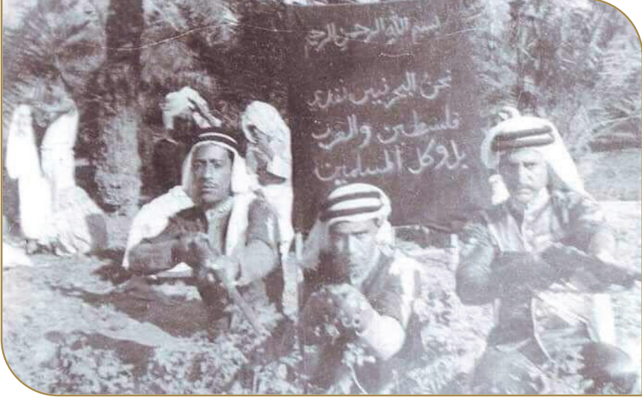
بحرينيون في فلسطين يدافعون عن الأراضي المحتلة والمقدسات