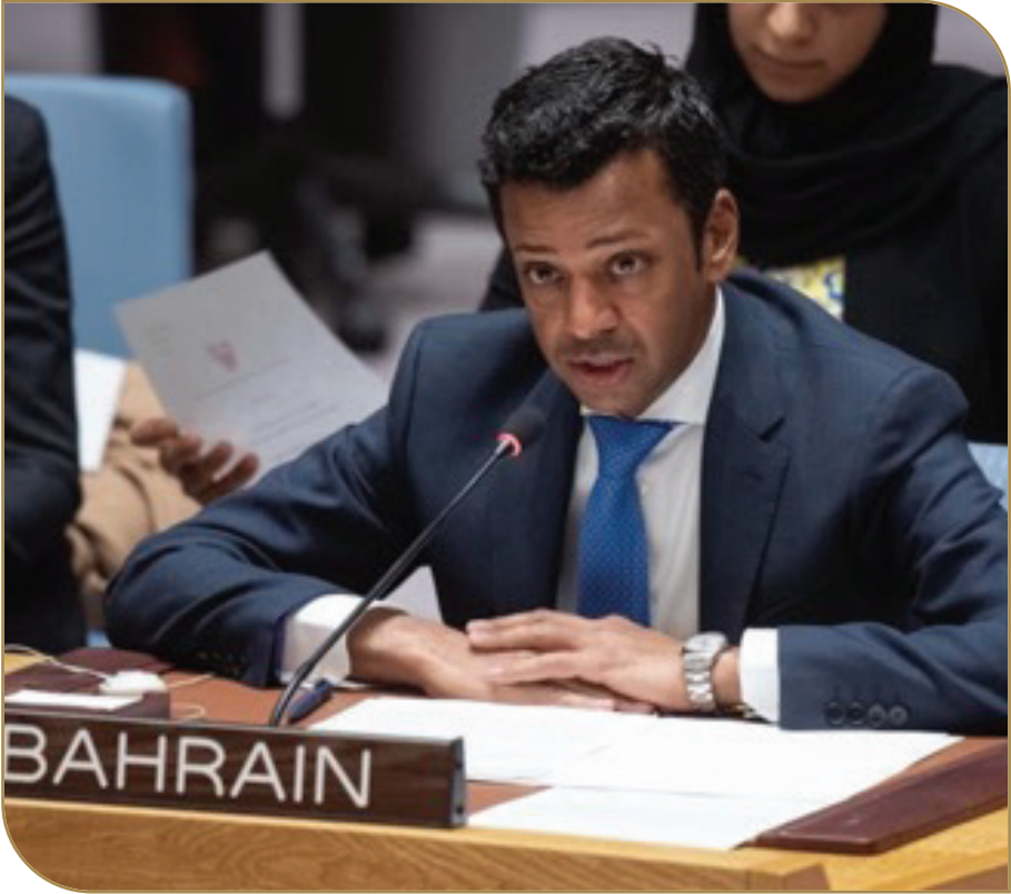
مندوب البحرين الدائم لدى الأمم المتحدة

وأكد أن هذا الموقف ليس بغريب على تاريخ البحرين المشرف تجاه القضية الفلسطينية وهو موقف ثابت وراسخ من دعم حقوق الشعب الفلسطيني المشروعة وقضيته العادلة.