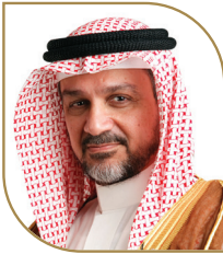
الشيخ ناصر الفضالة