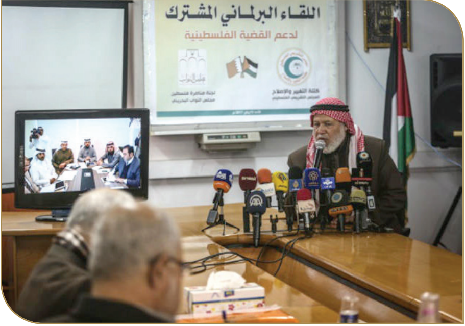
لقاء مشترك بين لجنة مناصرة فلسطين البرلمانية ونواب من غزة