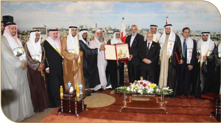
وفد برلماني بحريني في زيارة لغزة برئاسة رئيس مجلس النواب السيد خليفة الظهراني

قام وفد من مجلس النواب بمملكة البحرين برئاسة صاحب المعالي السيد خليفة بن أحمد الظهراني رئيس مجلس النواب بزيارة إلى المجلس التشريعي الفلسطيني بقطاع غزة خلال الفترة (٩ - ١١ مايو ٢٠١٣م)، بهدف دعم ومناصرة الشعب الفلسطيني، وقد شارك في هذه الزيارة رئيس كتلة المنبر الوطني الإسلامي رئيس لجنة مناصرة الشعب الفلسطيني بمجلس النواب النائب الدكتور علي أحمد عبد الله.