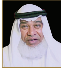
الشيخ جلال الشرقي