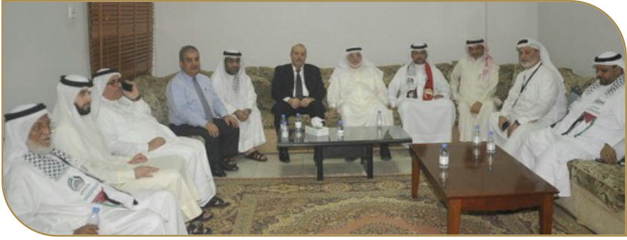
لقاء يجمع السفير الفلسطيني بعدد من أعضاء ونواب المنبر

شارك نواب من كتلة المنبر الوطني الإسلامي في الاجتماع بالسفير الفلسطيني في المملكة للتباحث حول نصره القضية الفلسطينية، وما يتعلق بالنواب والوزراء الفلسطينيين الذين تم اعتقالهم