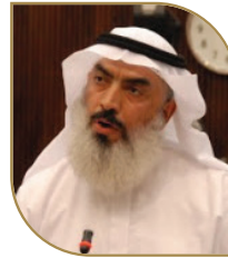
الشيخ محمد خالد