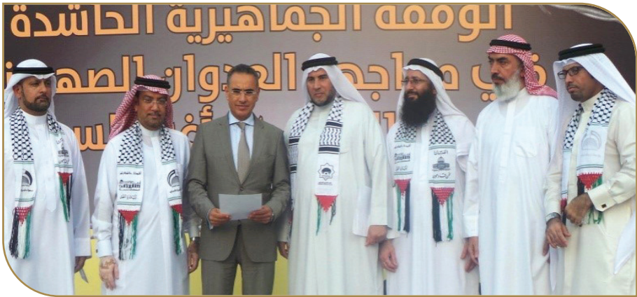
وقفة جماهيرية للتنديد بالعدوان على غزة

شارك عدد من قيادات وأعضاء جمعية المنبر الوطني الإسلامي وكتلتها النيابية في عدد من الوقفات الجماهيرية خلال السنوات الماضية أمام مبنى الأمم المتحدة بالمنامة، وذلك للمطالبة بفك الحصار الجائر عن غزة، ودعمها في مواجهة العدوان الصهيوني الغاشم