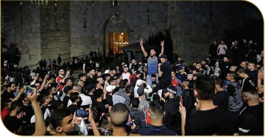
مقدسيون ينجحون في الوصول إلى المسجد الأقصى المبارك بعد محاولات منع صهيونية

وأضافت إن الجمعيات السياسية إذ تطالب المجتمع الدولي بالوقوف بحزم عند مسؤولياته تجاه ما يتعرض له الشعب الفلسطيني من اعتداءات وانتهاكات يومية من قبل الاحتلال ومستوطنيه وخاصة مدينة القدس المحتلة وذلك بتوفير الحماية الدولية للشعب الفلسطيني ومقدساته