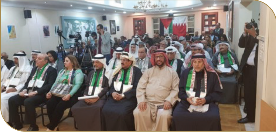
المشاركة في مهرجان «لا لصفقة القرن»

فلسطين لدى مملكة البحرين وأكد وفد الجمعيات السياسية في مملكة البحرين، على الموقف الثابت والراسخ لجميع القوى السياسية في مملكة البحرين تجاه القضية الفلسطينية والرافض بالمطلق لأي تطبيع مع الكيان الاسرائيلي الغاصب للأرض الفلسطينية المحتلة.