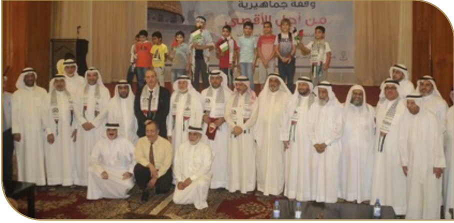
قيادات ونواب المنبر مع السفير الفلسطيني وقيادات جمعيات ومنظمات مجتمع مدني

وتدمير البنية التحتية، وسط تواطؤ دولي وصمت عربي، معتبرة ما يحدث بمثابة حرب إبادة ضد الصامدين المرابطين المدافعين عن أرضهم وحقوقهم المشروعة والمسلوبة.