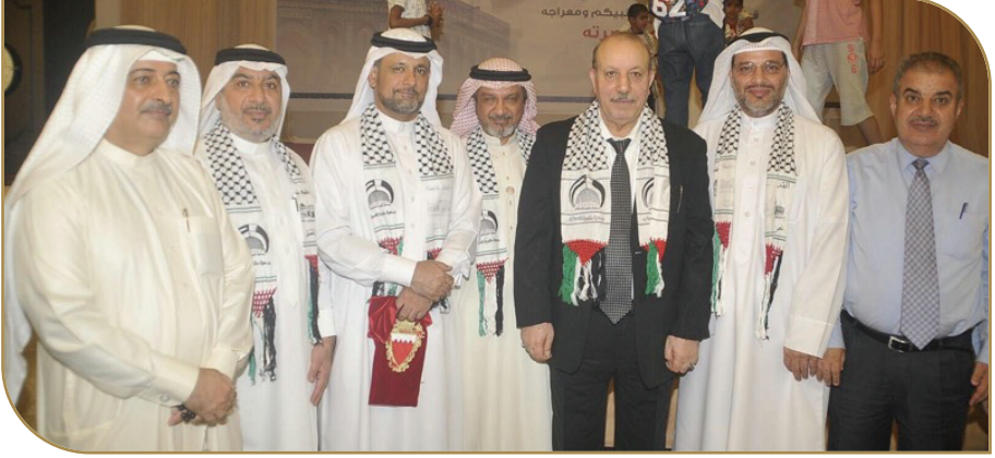
رئيس لجنة مناصرة فلسطين البرلمانية مع السفير الفلسطيني

تسويق وثيقة العهد الأبدي الذي قامت بإعدادها جمعية مناصرة فلسطين، وكان أول من تفاعل معها مجلس النواب، وتنص الوثيقة على المفاهيم الآتية: