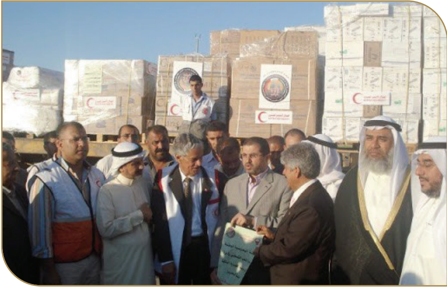
وفد بحريني في غزة

وأضاف: «نحن نعول على العلاقات الجيدة التي تربط بين مصر والبحرين»، مشيراً إلى أن معبر «كرم أبو سالم» الصهيوني «لا يعني لنا شيئاً، خاصة أنه معبر له سمعة سوداء، كما أننا نرفض التطبيع مع الاحتلال».